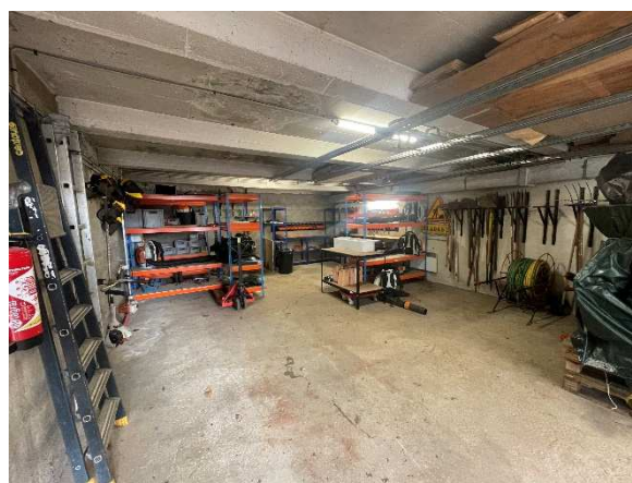
(Avant/Après réorganisation de l'atelier)

Le service des Espaces Verts se restructure et accroît son champ d'interventions pour réduire l'appel à des prestataires extérieurs et favoriser une meilleure gestion du site. C'est une opération de reconquête des espaces verts qui se déroulera