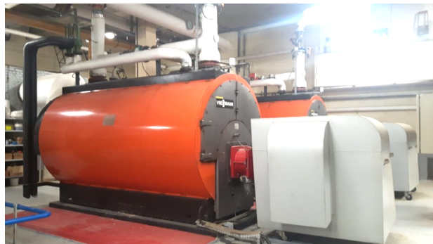
Chaufferie Élysée 2

Des sondes d'enregistrement de température sont encore disponibles. Si vous souhaitez en installer une, faites-en la demande au SCCR. DALKIA pourra alors vous fournir des relevés à votre demande.